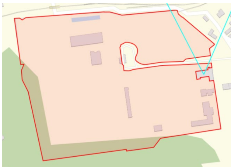
Situační plán mikrovlnných (MW) spojů